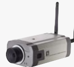
FCS-1091 WCS-1090 (Wireless, nicht-PoE-fähig) Tag/Nacht PoE IP Netzwerk Kamera