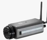
WCS-2070 Tag/Nacht IP Netzwerk Kamera