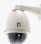
FCS-4010 Tag/Nacht Speed Dome Pro Netzwerk Kamera