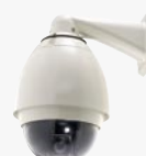
FCS-4020 Tag/Nacht Speed Dome Pro Netzwerk Kamera